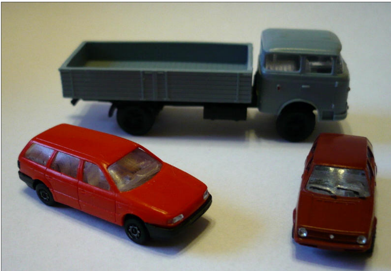
Obr.2 – Vybalená auta