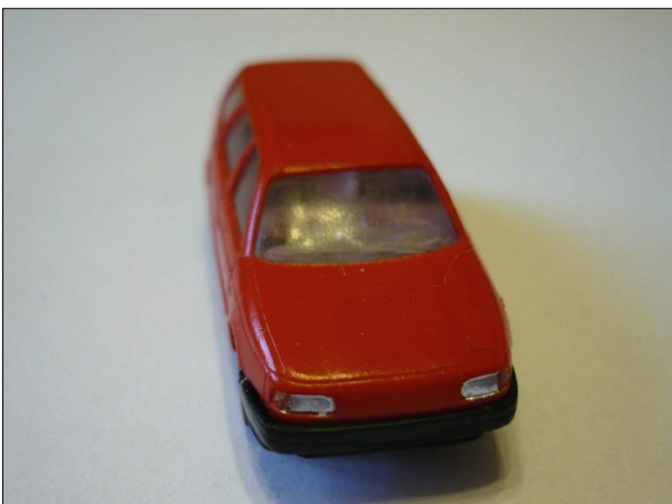
Obr.5 – VW Passat – čelní pohled