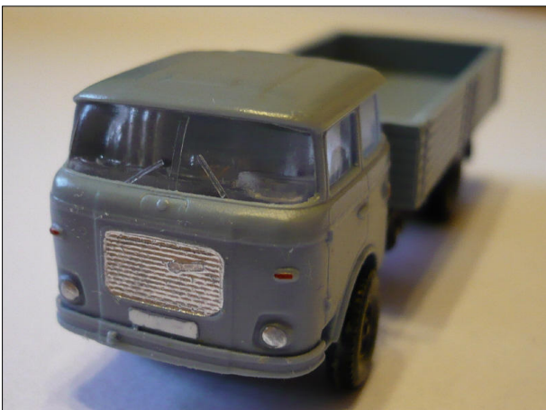
Obr.3 – Škoda RT 706 – čelní pohled