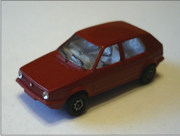
Obr.7 – VW Golf – čelní pohled