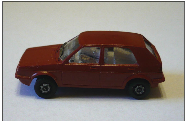
Obr.12 – VW Golf s koly rovně