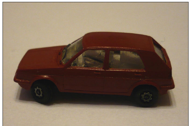
Obr.14 – VW Golf s koly stočenými vpravo