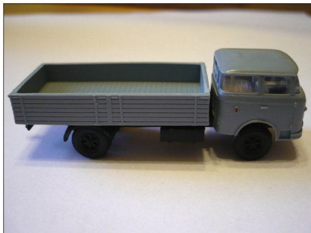
Obr.4 – Škoda RT 706 – boční pohled