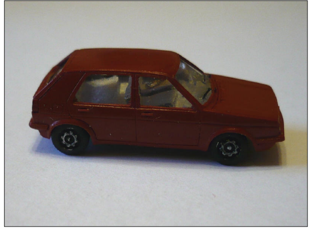
Obr.8 – VW Golf – boční pohled