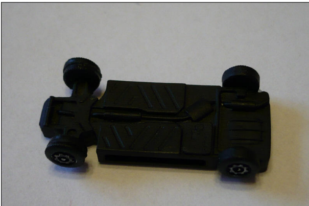
Obr.11 – Pohled zespodu na podvozek VW Golf