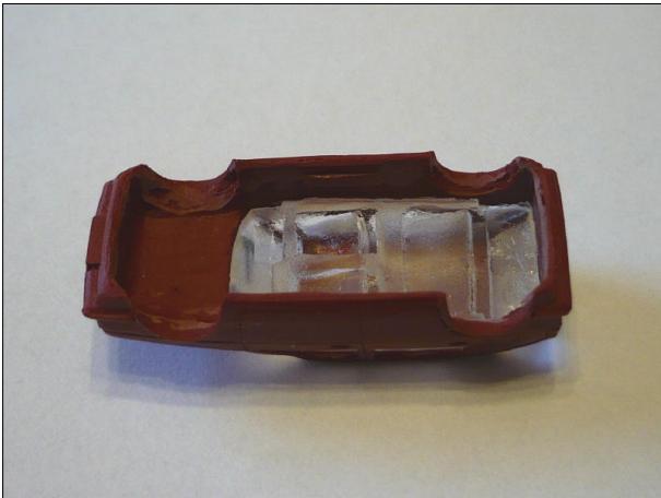
Obr.9 – Pohled do kabiny na negativní otisk interiéru