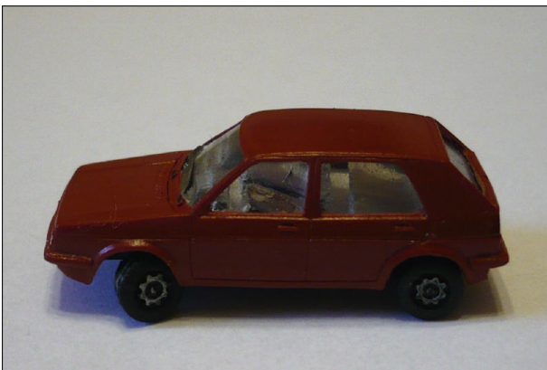
Obr.13 – VW Golf s koly stočenými vlevo