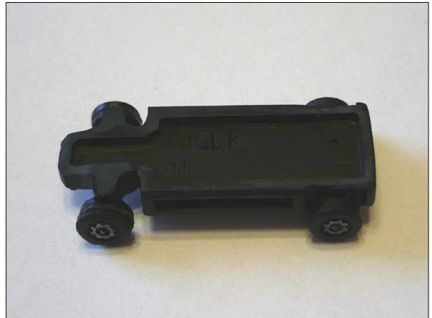
Obr.10 – Vyjmutý podvozek VW Golf