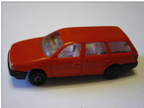
Obr.6 – VW Passat – boční pohled