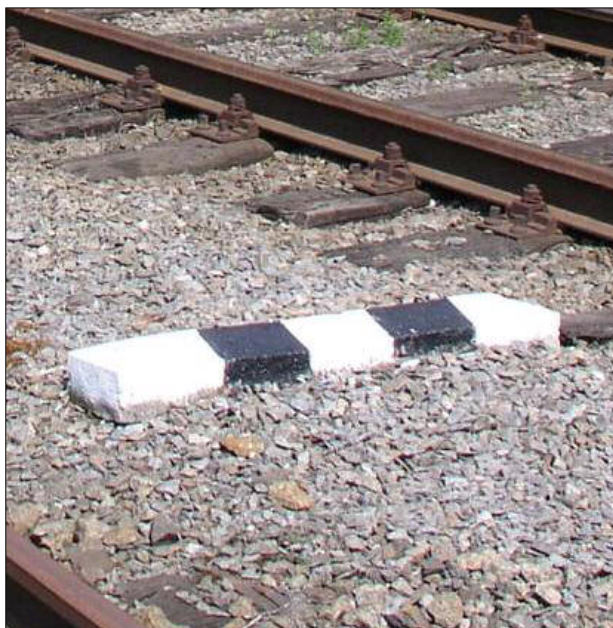
Obr.4 – Námězník v reálu