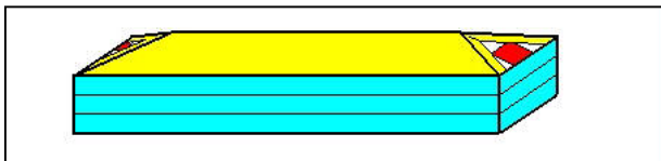
Obr.2 – Námězník-sestava